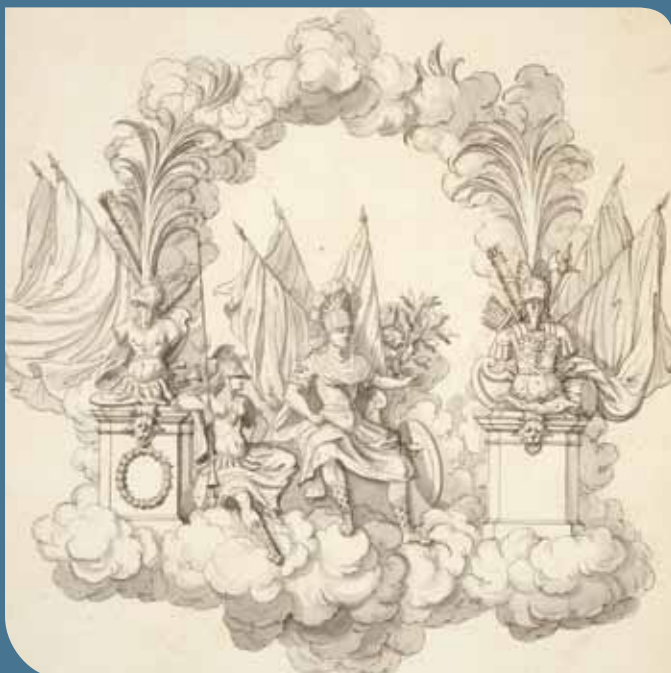
Char de Mars et de Bellone pour le prologue de Thésée (0/1 er /3239, fol. 37)