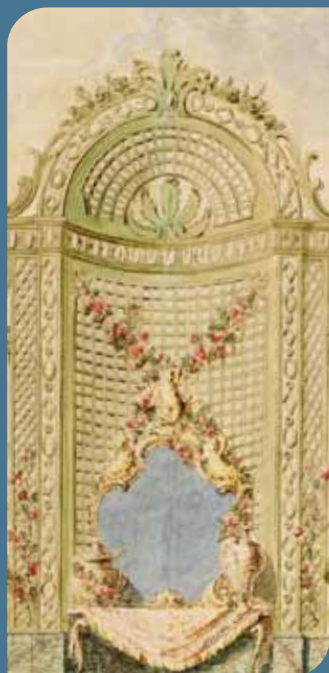
Décoration intérieure de l'Orangerie de Versailles (0/1 er /3265, fol. 4D)