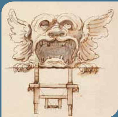
Monstre destiné à animer une scène infernale (0/1 er /3238, fol. 37a)