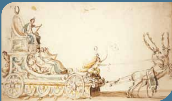
Projet de char pour le carrousel de 1612 (0/1 er /3241, fol. 84a)