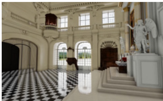
Modélisation 3D de la quatrième chapelle du château de Versailles Licence professionnelle Métiers du Numérique de l'Université de Cergy-Pontoise

Pour certains espaces présentant un grand intérêt historique (soit par l'importance de la pièce, soit parce-qu'il s'agit d'espaces disparus ou de projets jamais réalisés), des étudiants de l'université CY Cergy Paris Université (licence professionnelle « Métiers du numérique : patrimoine, visualisation et modélisation 3D ») produisent des reconstitutions virtuelles réalistes et de grande qualité technique et esthétique.