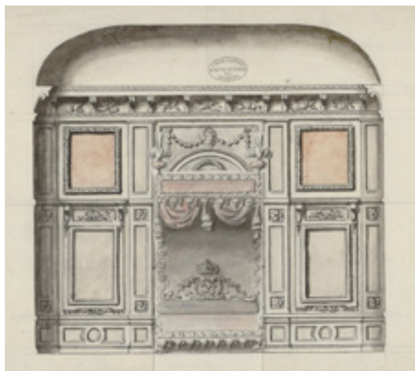
Coupe sur la chambre de la duchesse de Bourgogne au Grand Trianon [1698] Archives nationales, O/1/1884, dossier 1, n°8 Cliché: Archives nationales (France) - Avec le soutien de la Fondation des sciences du patrimoine / LabEx Patrima

Cette pièce, particulièrement bien documentée par une série d'élévations conservées aux Archives nationales, pourra être ainsi dévoilée à tous telle qu'elle était à la fin du XVII e siècle.