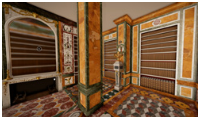
Modélisation 3D de la bibliothèque de Madame Sophie Licence professionnelle Métiers du Numérique de l'Université de Cergy-Pontoise