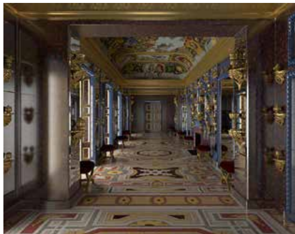
Reconstitution de la petite galerie de Mignard extraite du film réalisé par les étudiants de la licence professionnelle « Métiers du numérique - Patrimoine, visualisation et modélisation 3D » de l'université de Cergy-Pontoise, encadrés par Nicolas Priniotakis et Michel Jordan.

Pour certains espaces du château présentant un grand intérêt historique, des étudiants de l'université de Cergy-Pontoise (licence professionnelle « Métiers du numérique : patrimoine, visualisation et modélisation 3D ») produisent des visites virtuelles réalistes et de grande qualité technique et esthétique.