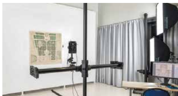
Plateau de prise de vue mis en place pour les plans de très grand format, avec un appareillage prototype.