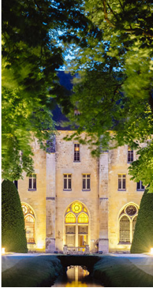
Abbaye de Royaumont