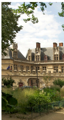
Musée de Cluny, vu depuis le square Paul-Painlevé à Paris, dans le 5 e arrondissement

Le Versailles secret : les appartements de Louis XV