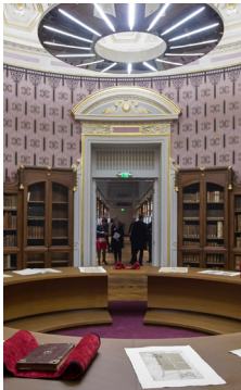
Bibliothèque de l'École des chartes

Visite du site Richelieu : bibliothèques, musée et galeries. Bibliothèque nationale de France, départements des Arts du spectacle ; des Estampes et des Manuscrits ; bibliothèque de l'Institut national d'histoire de l'art ; bibliothèque de l'École nationale des chartes, avec sa directrice. Présentation des collections : manuscrits occidentaux et orientaux, anciens et modernes, correspondances, archives, estampes.