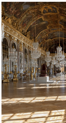
Galerie des glaces, château de Versailles, Versailles